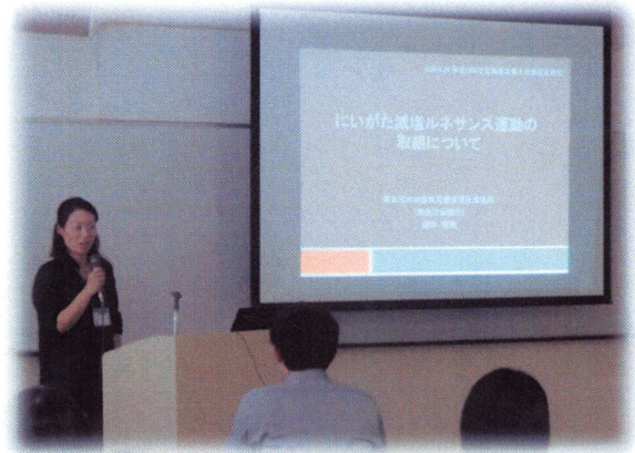
～減塩ルネサンスの取組みについて～

会場にサラダコスモ様、ライフプロモート様をお招きし、減塩調味料や大豆もやしについての展示・試食会や情報提供をしていただき、参加者からも好評でした。