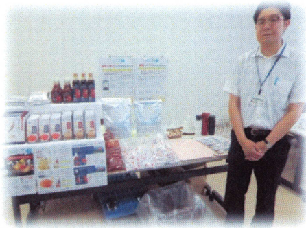
ライフプロモート 様

会場にサラダコスモ様、ライフプロモート様をお招きし、減塩調味料や大豆もやしについての展示・試食会や情報提供をしていただき、参加者からも好評でした。