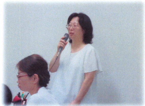
～活発な質疑応答が行われました～