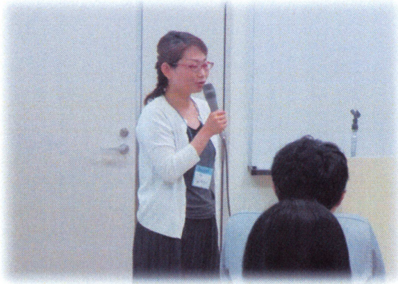
～在宅訪問栄養指導報告～