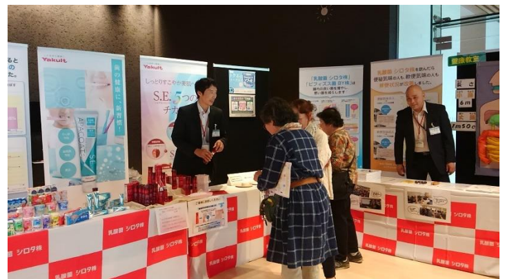
(株)ヤクルト様展示

日本栄養士会雑誌 10月号同封のチラシをご確認ください！！ お申込みお待ちしております。(ホームページにも掲載しています) ★11月30日(土)「新潟・食生活学会学術集会・講演会」案内 ★12月8日(日)「在宅ケアのための大研修会」案内