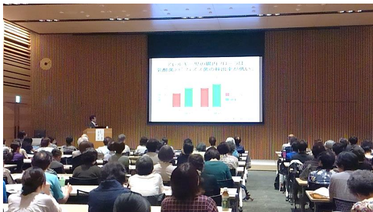
(株)ヤクルト様から情報提供